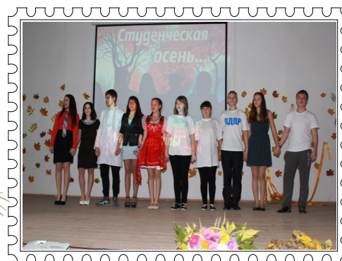
(на фото 142 группа)

Жюри было сложно выбрать победителей из нескольких достойных претендентов. Лучшими из лучших стали студенты 142 группы, они заняли заслуженное первое место!