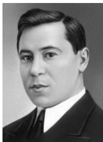
Татарский советский поэт, Герой Советского Союза

С этого года в газете «Милосердие» будет введена постоянная рубрика под названием «Поэтическая страничка». Здесь будет публиковаться творчество как студентов, так и преподавателей Ульяновского медицинского колледжа.