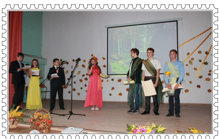
(на фото ведущие студенческой осени)

В номинации «Лучшая сценка» победили студенты 142 группы с композицией «Платная клиника»